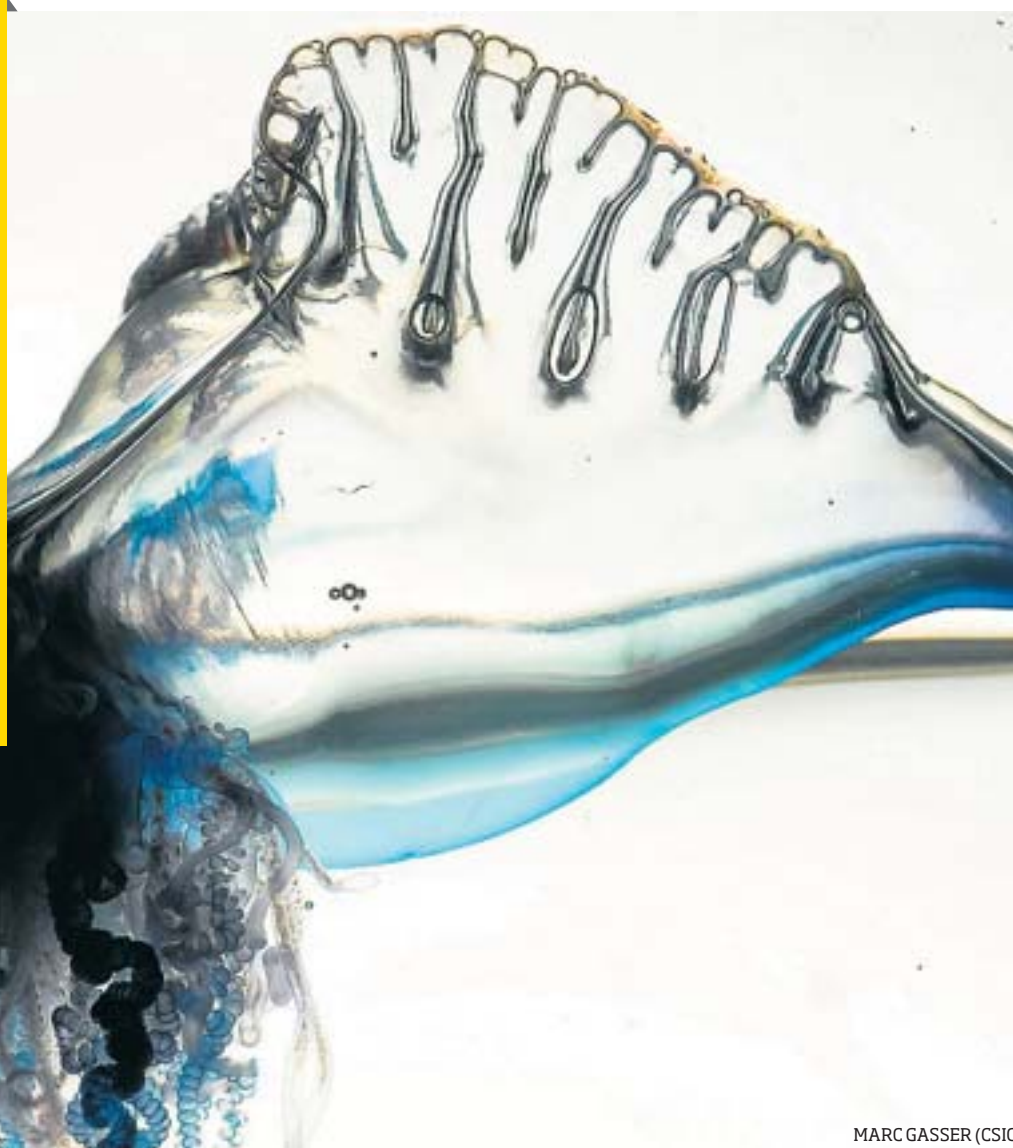
MARC GASSER (CSIC)

En la història de la nàutica el disseny de les embarcacions s'ha anat perfeccionant per aprofitar millor el vent. Inicialment les naus només navegaven amb vents favorables. De mica en mica van aparèixer veles més aerodinàmiques, els rums navegables es van ampliar i la velocitat va augmentar molt. Avui podem fer la volta al món a vela en menys de 80 dies, però fa 500 anys Colom no hauria arribat a Amèrica sense el vent a favor.