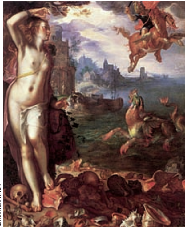
Andròmeda alliberada per Perseu , pintada per l'artista holandès Joachim Wtewael el 1611. Els pintors renaixentistes van associar sovint, erròniament, el vol de Perseu amb el cavall alat Pegàs. En la tradició dels mites grecs, Perseu vola amb les seves sandàlies alades.

«FINS I TOT NARRACIONS TAN POPULARS COM LA LLEGENDA DE SANT JORDI, QUE PODRIA SEMBLAR GENUÏNAMENT CATALANA, TENEN L'ORIGEN EN LA MITOLOGIA GREGA»