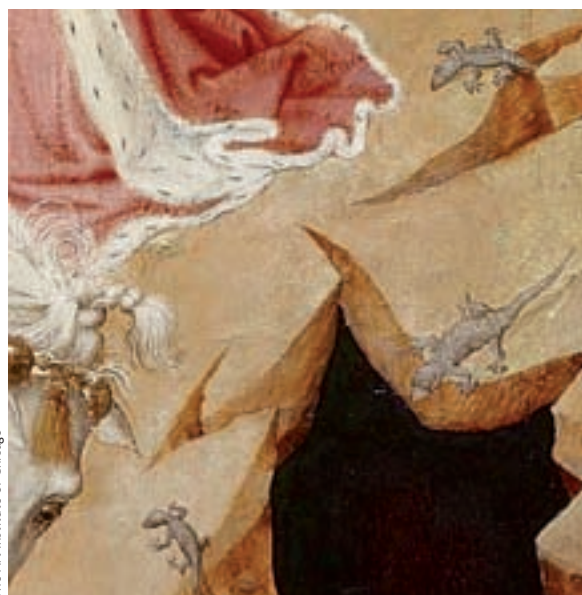
The Art Institute of Chicago

«LA REPRESENTACIÓN DEL DRAGÓN COMO UN REPTIL ES MUY RECIENTE. A LO LARGO DE LOS SIGLOS HA CAMBIANDO SENSIBLEMENTE. SE HA PINTADO COMO UNA SERPIENTE, UN DEMONIO O CON RASGOS DE MAMÍFERO»