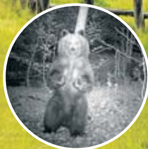
CONSELH GENERAU D'ARAN

Els óssos també són territorials. Es mouen per amplis espais on troben l'aliment, s'aparellen i mantenen refugis per dormir o hibernar. Les seves fronteres les senyalitzen periòdicament fregant-se als arbres per deixar-hi l'olor. Encara que siguin invisibles, aquestes fronteres tenen la funció d'allunyar els intrusos i evitar conflictes. Tant en política com en ecologia, bones tanques fan bons veïns.